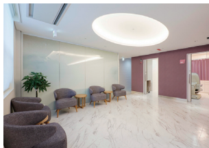
婦人科診察室に隣接した女性専用待合